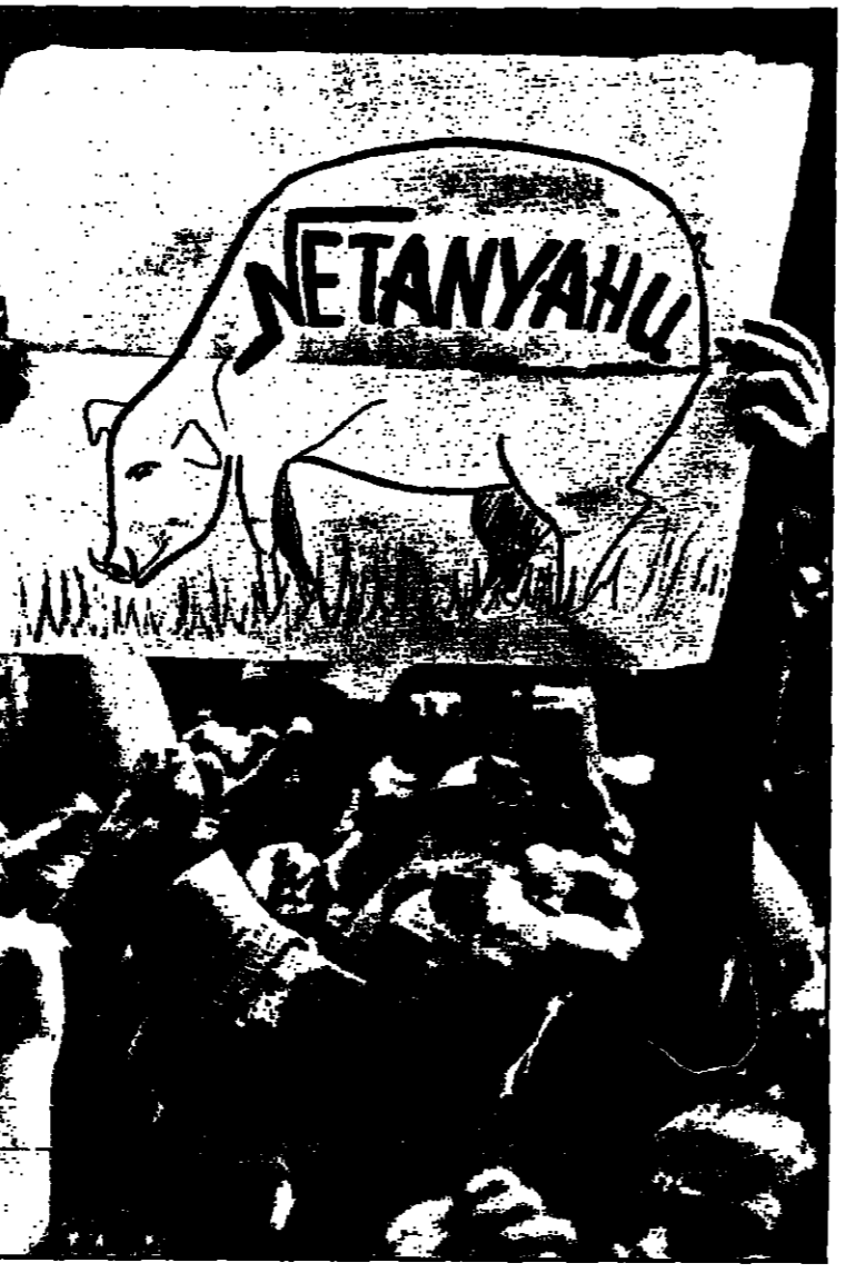
اسلاميون يتظاهرون في اسطنبول الجمعة برفضهم خطة تصدير رؤس وزراء اسرائيل بضمين نتنياهو بخريف